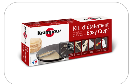
Kit d'étalement Spreader kit AKE84