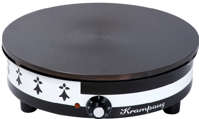
Gwenn Ha Du CEBED4