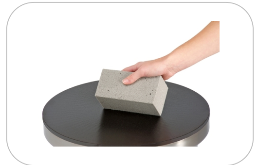
Pierre abrasive Abrasive stone APA1