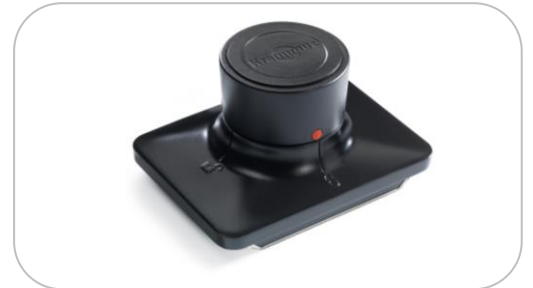
Tampon de culottage, de graissage & d'essuyage Cleaning pad and spare felts