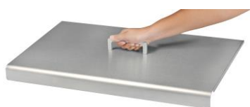
Cubierta para la plancha Design simple (Ref. ACP6)