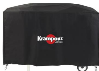
Funda para el carro Plein Air (Ref. AHC1)**