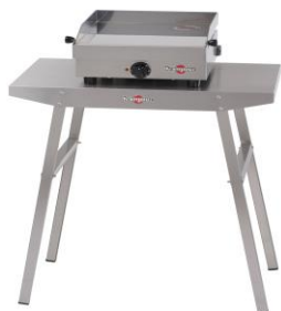
Tisch plein air für plancha-grill Design simple (bez. Kheb01)*