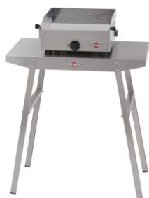
Support Plein Air pour plancha Design simple (Ref. KHEB01)*