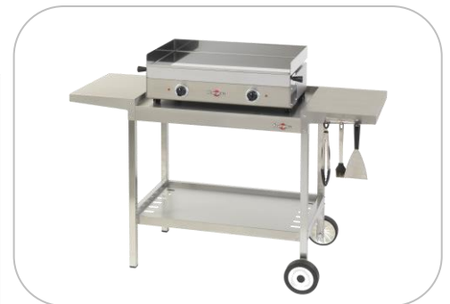
Chariot PLEIN AIR / Cart PLEIN AIR