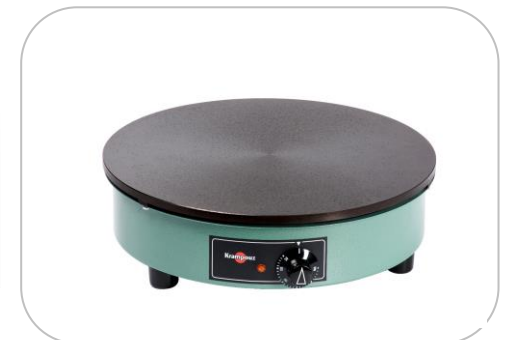
Crêpière BILLIG/ Electric crepe maker BILLIG