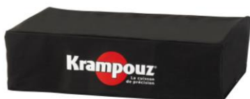
Funda para la plancha Design doble (Ref. AHP2)