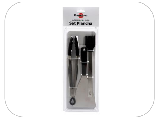
Set accessoires Plancha / Set accessories for plancha