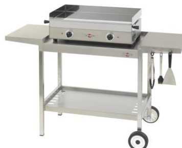
Carro plein air para la plancha Design doble (ref. Khea04)*