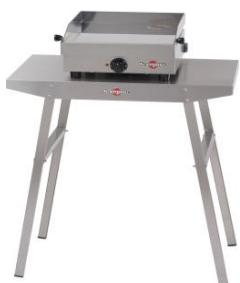
Soporte plein air para la plancha Design simple (ref. Kheb01)*