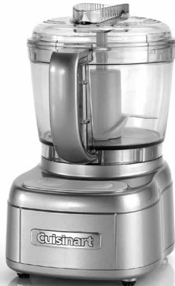
MINI PREP PRO ECH4 Series Q158A